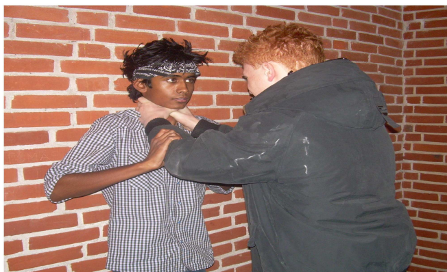
mængden af både verbal og voldelig racisme er stigende

Hvad er så grunden til denne øgede accept. Det skyldes højst sandsynligt at mediernes øgede fokus på vold og kriminalitet blandt unge af anden etnisk baggrund, såvel som terror og Irak-krig. Mange undersøgelser har