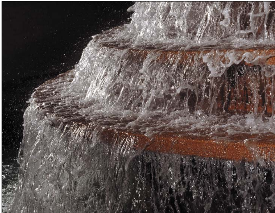
Iltningstrappe, hvor drikkevandet bliver luftet på vandværket.

Epidemiologiske undersøgelser har vist, at grundstoffet arsen selv i små mængder kan forårsage alvorlige sygdomme. Grænseværdien i drikkevand er derfor sænket til en femtedel af den tidligere værdi. Det giver en del problemer for grundvandet som drikkevandsressource.